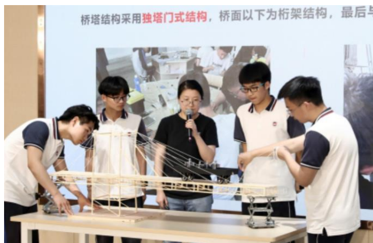
图 3 嘉兴市建筑工业学校“我的家”专业教学成果展

嘉兴市建筑工业学校结合建筑专门化学校的特色和优势，以“一核心、双主线、六维度、三阶段”的设计思路，将建造“我的家”所包含的思政元素贯穿教学育人“全链条”，通过打造一二三联动“大课堂”、跨部门跨区域“大平台”、家校企社协同“大师资”，创新“大建筑”特色育人模式。学生竞赛表现突出，实现全面发展；学校合作平台升级，引进优质人才；育人模式推广借鉴，辐射山海长三角，将“大建筑”育人模式，推广辐射至丽水技师学院及长三角职业院校，为同类院校打造具有校本特色的“大思政”育人模式，提供了新思路。