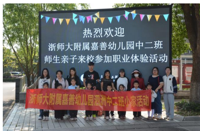
图 4 幼儿园师生和家长到嘉善信息技术工程学校进行职业体验

嘉善信息技术工程学校积极开展职业教育启蒙教育，多角度、多层次、全方位地展示了学校专业实力与师生风采。通过专业融通、大师进校、师生竞技、讲好职教故事等活动，扩大了办学影响力，以“劳动光荣、技能宝贵、创造伟大”的时代风尚，努力在全社会营造职业教育“前途广阔、大有可为”的良好氛围。浙江师范大学附属嘉善幼儿园 3 个班的师生和家长到学校进行职业体验。