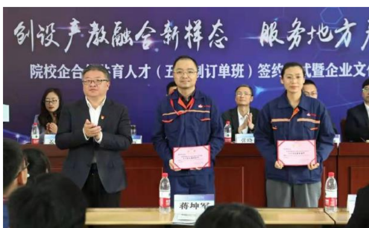
图 5 平湖市职业中等专业学校院校企订单班签约仪式

平湖市职业中等专业学校积极推行专业认证、有效课堂认证和学生技能认证，构建人才培养从设计、实施到评价的闭环质量保证体系。化学工程部引入德国 AHK 职业培训与考核体系，在教学模式、课程体系、考核方式、课程资源建设等方面进行“双元制”的本土化改革与实践；2021-2023 届多个班级与区域龙头化工企业合盛硅业、嘉化能源、新风鸣集团等建立校企学徒制订单班培养体系，对标欧盟标准，参与德国“1+X”证书试点工程，中高职合作培养学生，实施技能等级证书覆盖工程。