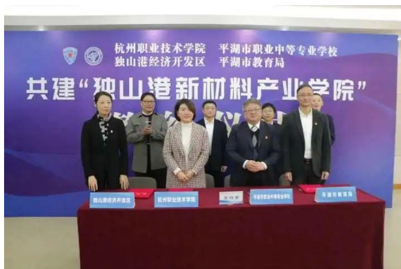
图 15 平湖市职业中等专业学校四方共建“独山港新材料产业学院”签约

和化工龙头企业合作，构建“院（高职）校（中职）企（企业）”深度融合的育人共同体。通过确定“三元育人”实施主体、深化“三元育人”培养结构、铺设“三元育人”实现路径，探索院（高职）、校（中职）、企（企业）三主体的共同育人目标，在协作过程中有效建设一体化课程体系、培养双师型教学团队、建设融合型产业学院，实施互融式共同评价的人才培养机制。实现三主体的共融、共建、共赢。