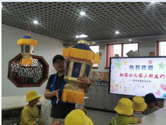
图 13 桃园幼儿园小朋友们探寻非遗技艺活动

海宁市职业高级中学是硖石灯彩浙江省非遗传承教学基地，立足于硖石灯彩技艺、文化的传承教学，建有以省级劳动模范、省特级教师、嘉兴市第三批非遗项目（硖石灯彩）嘉兴市级代表性传承人寿斌杰老师领衔的名师工作室，国家级非遗项目（硖石灯彩）国家级代表性传承人胡金龙大师工作室。2023 年度共组织“非遗进校园”“非遗进社区”活动 20 场，2035 人受益。寿老师为浙江省中小学非遗传承骨干人才培训班开设公开课和讲座；为澳门创新中学、浙江省中小学传统文化传承教育教学能力提升班、慈溪锦堂高级职业中学作专题讲座。海宁市职业高级中学“非遗进校园”公益活动及工作室教研活动得到“人民网客户端”“浙江新闻客户端”“学习强国”等媒体报道。