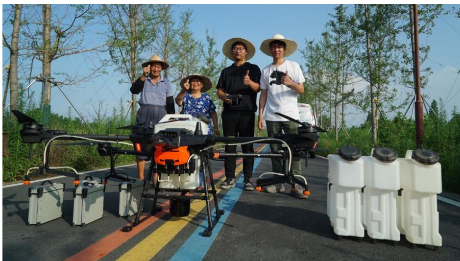
图 7 平湖市职业中等专业学校优秀毕业生创立了农业科技公司

满意度较高。 调查显示，毕业生满意度 97.13%，其中应届毕业生满意度 97.14%；教职工满意度 96.44%；用人单位满意度 98.34%；家长满意度 96.17%。