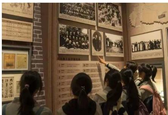
图 11 平湖市职业中等专业学校业余党校学员参观南湖革命纪念馆

平湖市职业中等专业学校通过举办业余党校提高班，从“理想信念、爱国情怀、责任担当、奋斗精神”四个维度设计课程，每个维度设计 6 学时，力求开展内容丰富、形式多样的政治学习。2023 年第 27 期党校提高班共培养 39 名优秀学员，先后赴嘉兴南湖、红色转角湾、中国百年保温瓶展览馆等地考察调研，寻访红色足迹，学习百年党史，了解革命故事，旨在引导学生用脚步丈量祖国大地、用眼睛发现中国精神，在学思践悟中坚定理想信念。