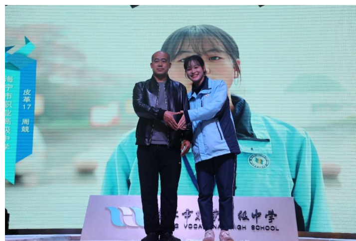
图 2 海宁市职业高级中学 爸爸的皮衣展示

海宁市职业高级中学通过产教融合和德技并修理念，打造“链上教育”的育人新模式。其中，以“爸爸的皮衣”为主题的项目实训作为学校德技并修育人模式的品牌，通过设置不同难度的产品生产综合实训项目，学生在为父母量体、设计、裁衣、制作的整个过程中加深了与父母的交流和理解，活动渗透感恩教育，增进了亲子关系。学校每年举办的“爸爸的皮衣”毕业设计汇报演出活动，将“政行企校”“技能与德育”有机地融合在一起，已经成为学校“链上教育”的一个品牌项目。