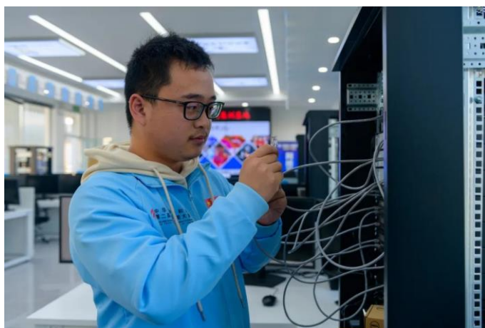
图 6 嘉兴技师学院选手参加中华人民共和国第二届职业技能大赛

嘉兴技师学院具备国际、国家级和省级技能竞赛组织管理经验。嘉兴技师学院中国集训基地成立于 2021 年，基地设有集训区域、实训区、讨论区域等，基地配有 18 套与世赛标准一致的工位，满足世界标准及集训需求。依托于专业建设，基地为学生提供了一系列的培训课程和实践机会。通过参与基地的培训项目，学生有机会接触到最新的技术和行业趋势，通过实践和竞赛提升专业技能。