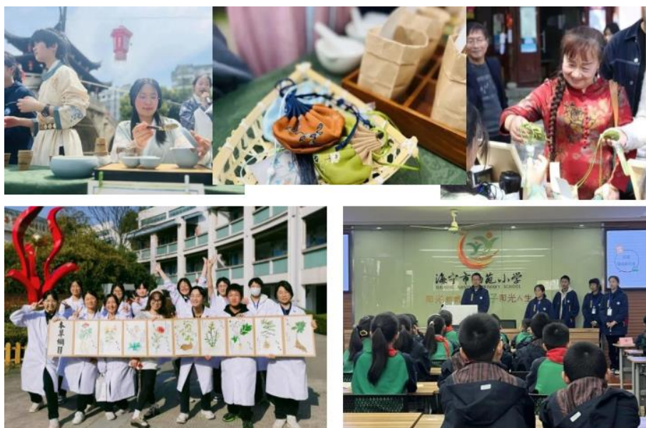
图 12 海宁卫生学校传承中医药学文化

海宁卫生学校以中药专业为依托，以本草培植社为平台，根据节气与本草培植相结合，通过中医药文化进社区进校园活动，传承包含着中华民族几千年的健康养生理念及其实践经验的中华文明的瑰宝中医药学，让体验者了解中草药的生长过程并学习制作草药成品，将草药制品进行孝赠长辈、爱心义卖、志愿献爱心活动。