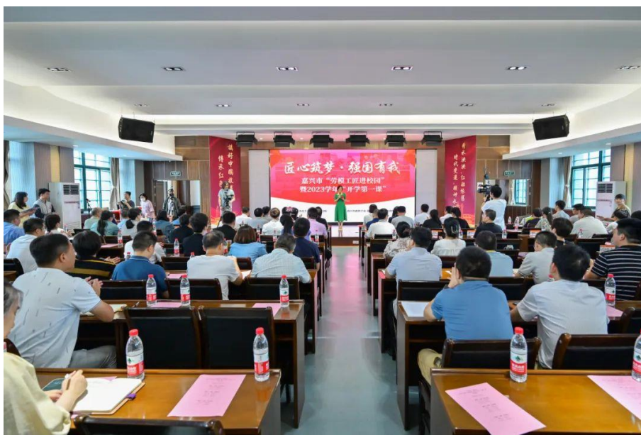
图 9 嘉兴市“劳模工匠进校园”暨 2023 学年“开学第一课”在嘉兴技师学院开课

“匠心筑梦·强国有我”嘉兴市“劳模工匠进校园”暨 2023 学年“开学第一课”，在嘉兴技师学院开课。嘉兴技师学院一直以来积极响应号召、大力弘扬劳模精神、劳动精神和工匠精神，师生中获得浙江工匠、浙江青年工匠、嘉兴市劳模、嘉兴工匠等市级及以上劳模工匠类荣誉 40 余人次。在追逐工匠梦、强国梦的道路上，嘉兴技师学院将持续向阳奔跑，为中国制造强筋健骨、为中国文化立根固本、为中国力量添砖加瓦。